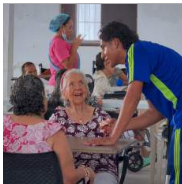
La iniciativa promovió el bienestar físico, emocional y social de los adultos mayores.

Con una jornada de integración, estudiantes del Programa Profesional en Deporte compartieron con los residentes del Centro de Bienestar al Anciano 'Sagrados Corazones de Jesús y María', promoviendo hábitos saludables y fortaleciendo los lazos de solidaridad. Ver 1B