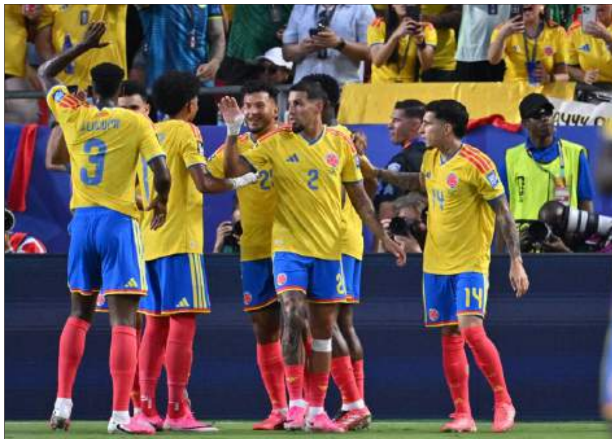
Los colombianos, que enfrentan a una Suiza que parte con la ventaja de haber jugado ya sobre el césped de Vancouver, buscan un histórico pase a los cuartos de final, una hazaña que no logran desde el Mundial de Brasil en 2014.